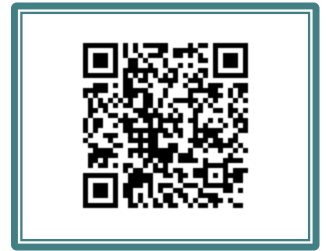
申込用二次元コード