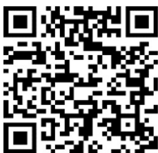
高知県糖尿病看護 土佐の会 プライバシーポリシー

テルモ株式会社 個人情報保護方針 https://www.terumo.co.jp/privacy_policy